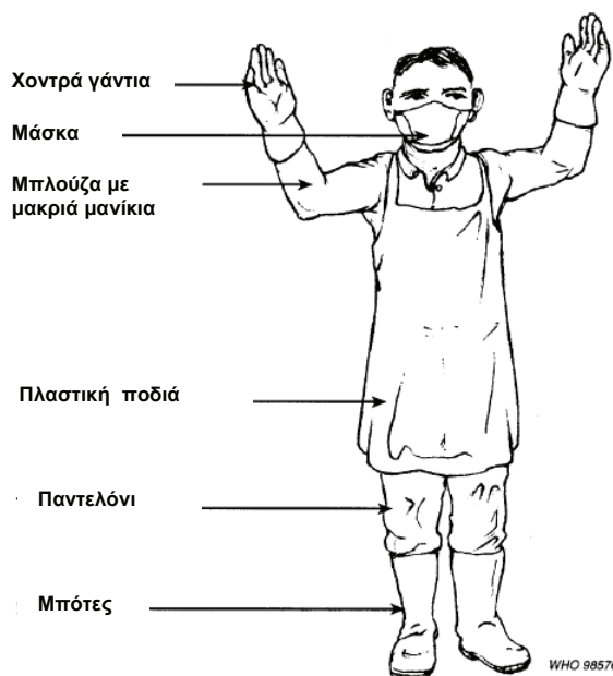
Σχήμα 5: Συνιστώμενη ενδυμασία κατά τη μεταφορά ΕΑΥΜ

Παρακάτω παρουσιάζεται η συνιστώμενη ενδυμασία κατά τη μεταφορά ΕΑΥΜ.